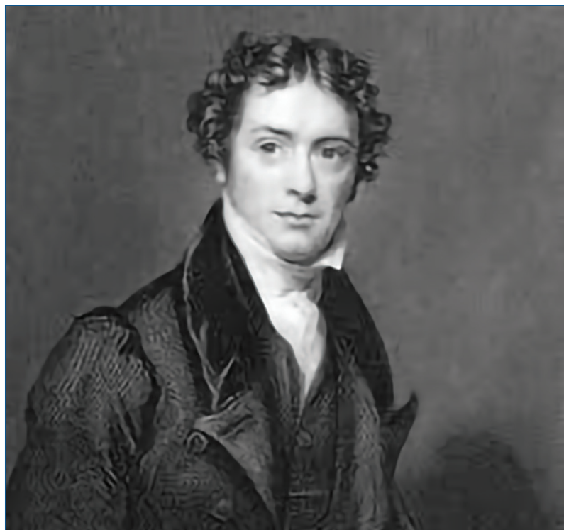
Fig. 1 - Ritratto giovanile di M. Faraday