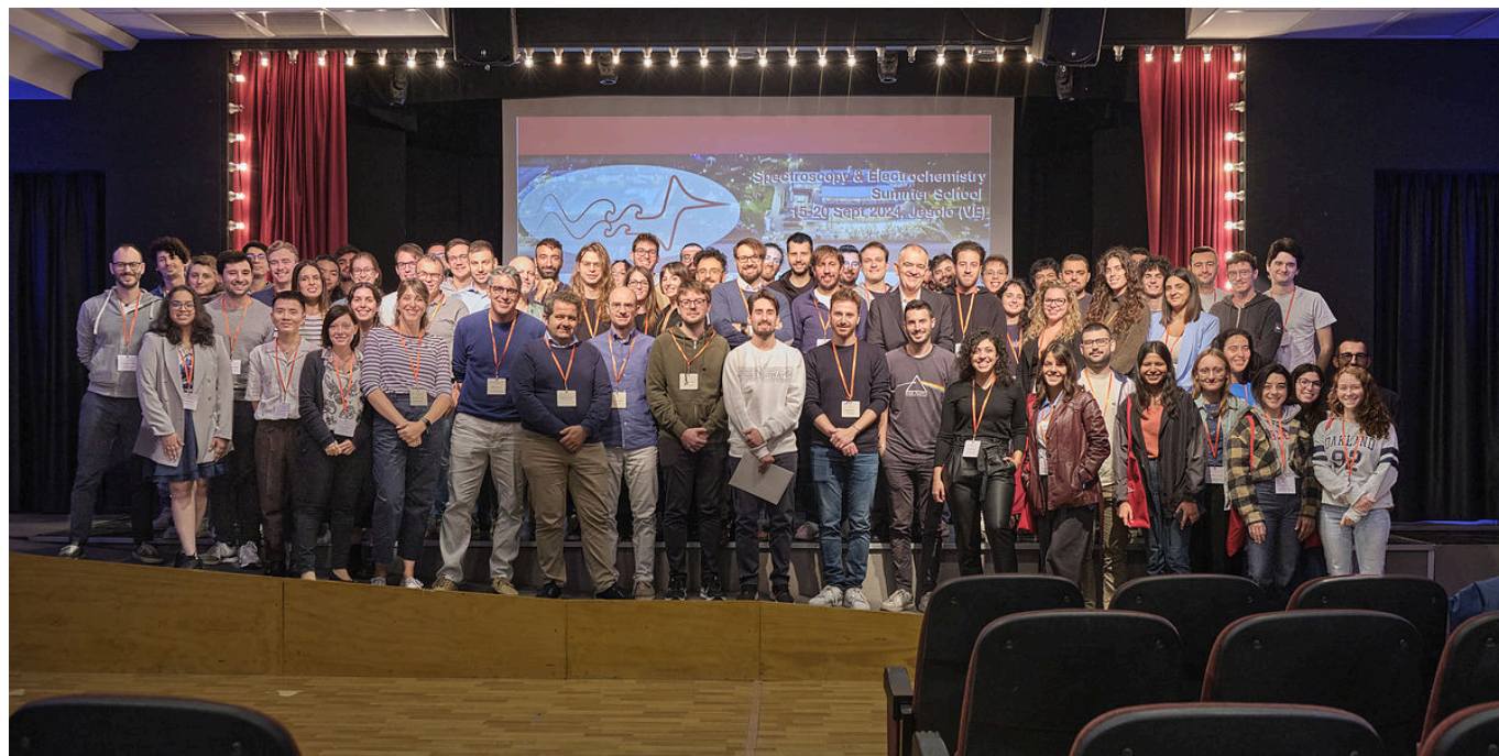
Partecipanti alla scuola 'Spectroscopy and Elettrochemistry Summer School' (SPEC2024)

sito web: https://www.disc.chimica.unipd.it/spec_school [16]